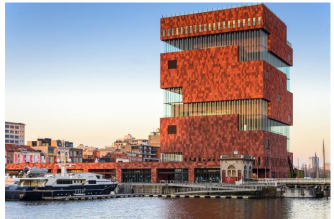
Het MAS in Antwerpen.

Over de duur van de eventuele reis (middag-of dagtocht) was geen opgave voor gegeven.